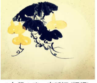
7 年级 9 班 李昕颖《福祿》