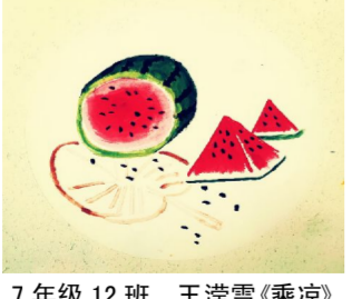
7 年级 12 班 王滢雪《乘凉》

“时间时间像飞鸟,嘀嗒嘀嗒向前跑……”幼儿园大班的小朋友们离步入小学生活的日子越来越近了!孩子们每天都倒对着,盼望着成为小学生,在他们的心里,成为一名小学生是件多么令人自豪的事!