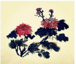
7 年级 3 班 王小艺《秋色》