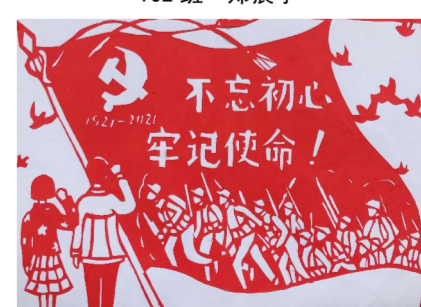
202 班 黄地骋