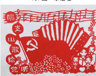
201 班 金哈露