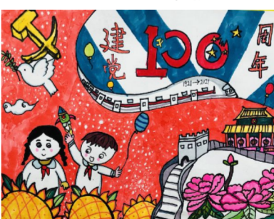
101 班 卓语垲