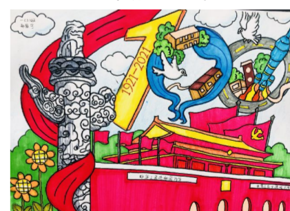
102 班 郑寰宇