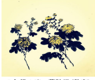
7 年级 8 班 董孙闻《秋意》