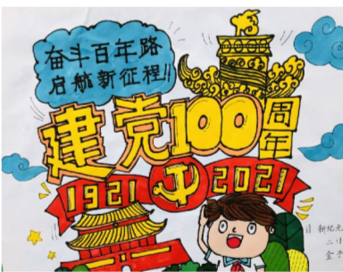
201 班 金子扬